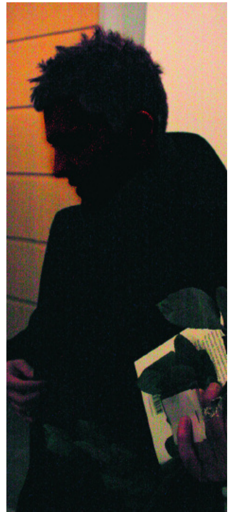
Aram misshandlades av sina bröder för att han uppfattades som fjolig. Han lever nu under skyddad identitet.